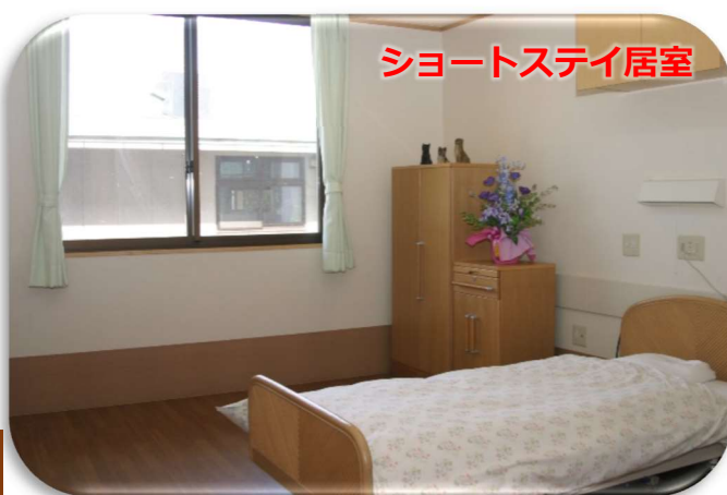
ショートステイ居室