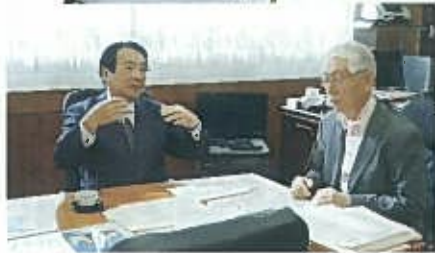
写真は 麻生渡 元福岡県知事来訪時▶

そんな年長者の里の女性職員登用の取り組みが評価され、「女性の活躍推進福岡県会議」より会員として認定されました。