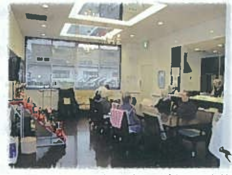
現在のグループホーム大蔵