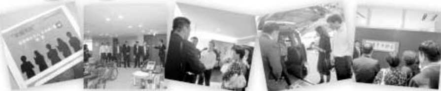
中国語を交えた資料 正寿園デイケア 矢継ぎ早の質問に 送迎用の車に 麻生元首相の 井上総務部長作 リハビリルーム 通訳さん大忙し 興味津々 扁額は大人気