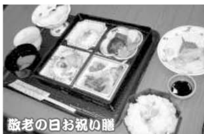
敬老の日お祝い膳