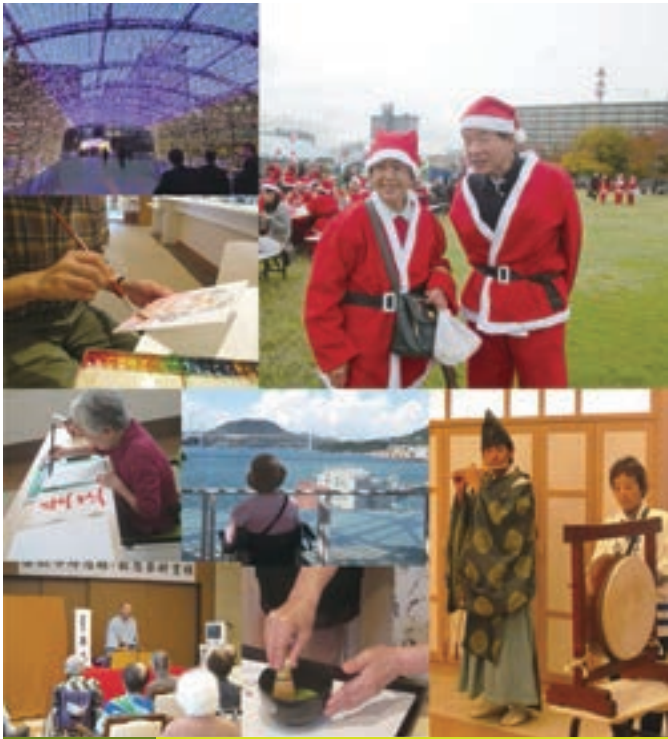
イベント編 小倉イルミネーション・北九州サンタラン(勝山公園)・貴船神社神事・お茶会・落語鑑賞・書道教室・門司海峡ドラマシップ・似顔絵アート