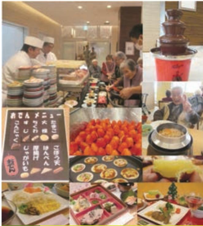
お食事編 出張回転寿司・チョコレートフォンデュの日・釜飯・焼き芋大会・パフェの日・ピザ作り・おでん・バイキング・七夕膳・敬老膳・クリスマスディナー

年を重ねて、少し不自由を感じていらっしゃるご入居者様、ご利用者様に、日々をどう楽しんでいただくか…スタッフにとっては、重要な課題であり、また考えるのは楽しみでもあります。