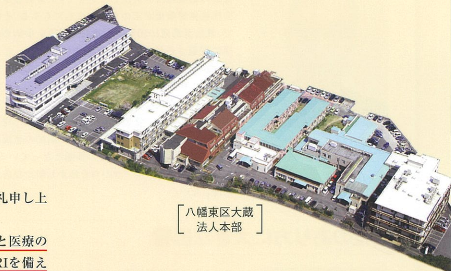
【八幡東区大蔵 法人本部】