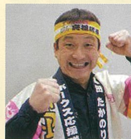
タレント 西田 たかのり