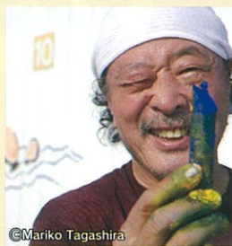
イラストレーター 黒田 征太郎