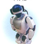
介護コミュニケーションロボット バルロ