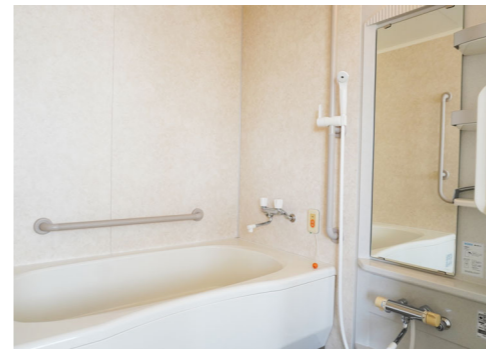
お風呂(ナースコール付き)