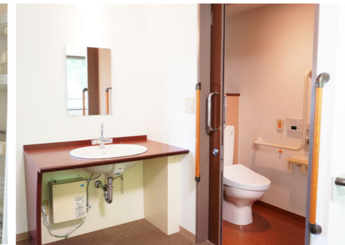
お手洗い(ナースコール付き)