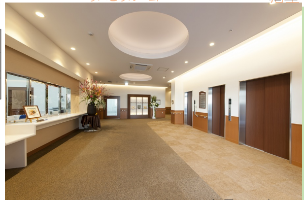
エントランスホール