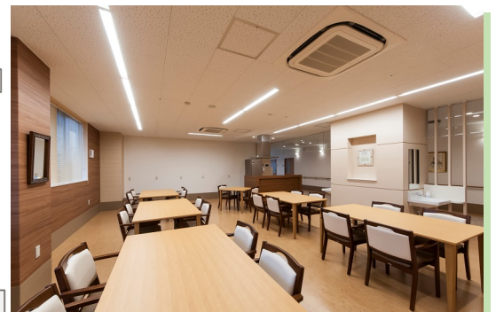
リビングダイニング (各階)